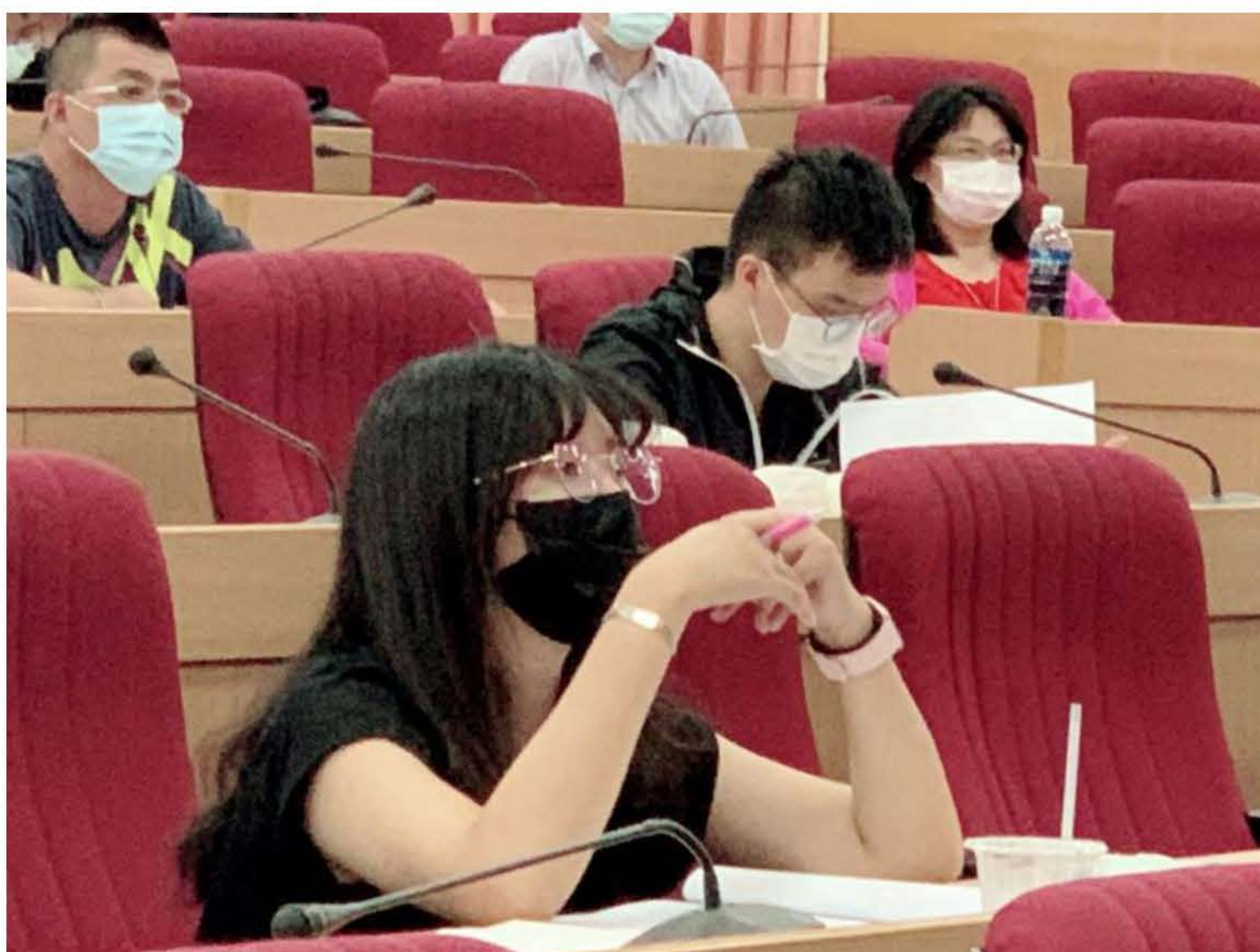
台南遠東科技大學暑假「潛能英語開發學習特訓」，師生受益多。