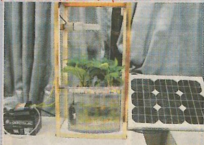
勤益科大複合養殖與空氣清淨系統勇奪全場次首獎。