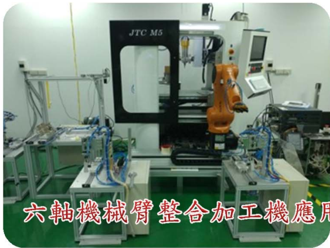
六軸機械臂整合加工機應用