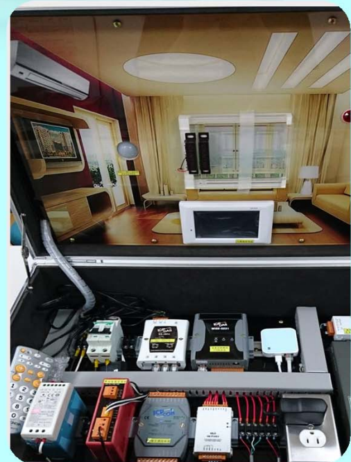
智慧家電app監控系統